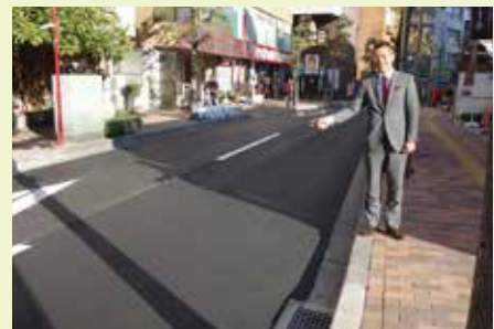
▲ひび割れと水溜りのひどかった舗装も、雨の日に滑り易かった歩道もすっかりきれいになりました。

ジが悪いかもしれませんが(笑)、道路整備が実は他の多くの政策の基盤にもなっていることも事実です。