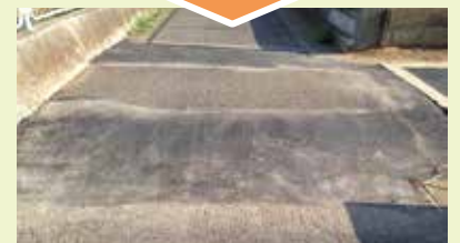
▲国分6丁目10番地先。段差が解消され安全に通行できるようになりました!

しかしながら、市道総延長は約700kmあるのに対して、道路建設予算は年に数km分しか確保されていないのが実情であるなど、道路政策にこそ市民ニーズとのかい離が際立っているよ