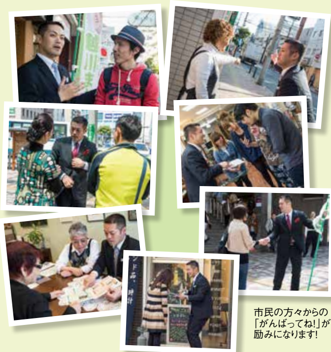
市民の方々からの「がんばってね!」が励みになります!

うにも思えます。たかが道路、されど道路。地味な仕事ではありますが、私は道路の充実こそが市政の総合力向上のキーワードの1つであると考えています。