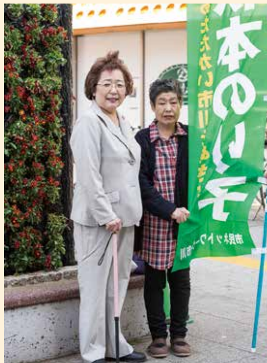
▲いつも素晴らしい女性たちに支えられています