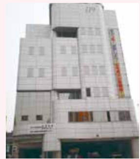
▲市川市男女共同参画センター

健康教室で自己管理のための体操や軽い運動に多くの女性の参加があります。男性の申し込みはごく少ないようです。健康教室の休憩時間等に